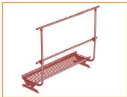
Комбинация кровельного ограждения с переходным мостиком

После монтажа регулировочного кронштейна на него сверху установить платформу переходного мостика (не входит в комплект поставки) и зафиксировать ее болтами. Опору ограждения закреплять к платформе переходного мостика.