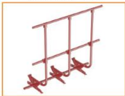
Комбинация кровельного ограждения со снегозадержателем

При монтаже кровельного ограждения установить в нижнее отверстие универсального кронштейна дополнительную трубу овальную 25x45 мм, длиной 3 м (не входит в комплект поставки), выполняющую функцию снегозадержателя.