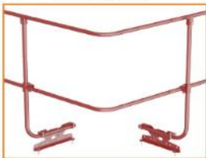
Соединение Кровельных ограждений в единый контур

Необходимо соблюдать направление труб ограждения с учетом их обжатия при стыковке с углом соединения кровельных ограждений.